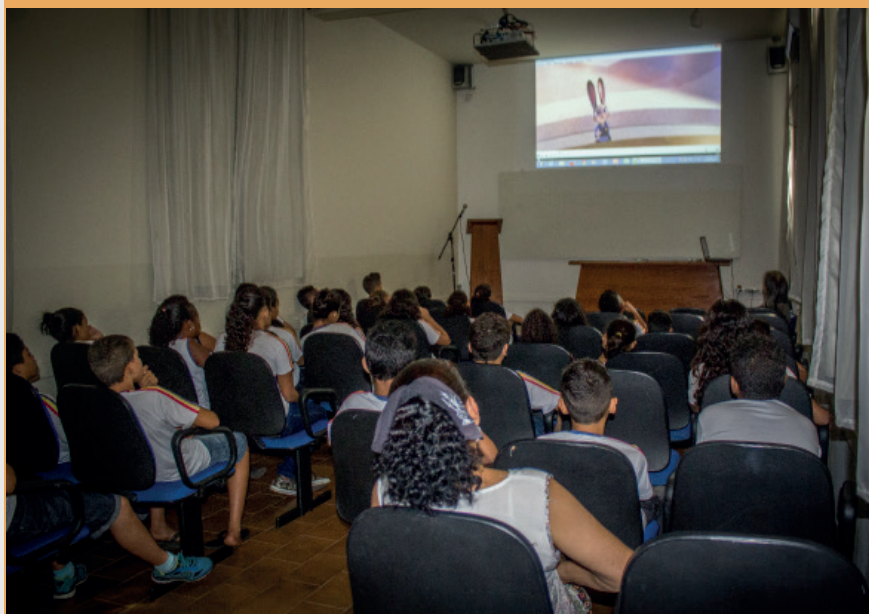
Projeto CineFAC recebendo os alunos da Escola Estadual Interventor Alcides Lins